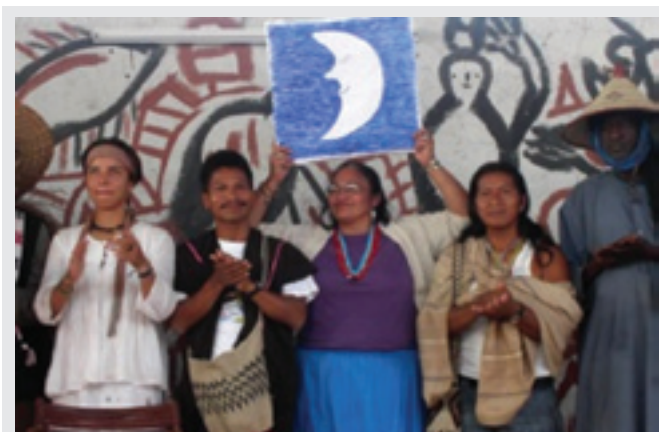
Foto: Participantes del foro sobre la soberanía alimentaria que tuvo lugar en Mali en febrero del 2007.

En esta declaración, los firmantes manifiestan luchar contra todo sistema que empobrezca la vida, los recursos y los ecosistemas; y contra los agentes que los promueven, como las instituciones financieras internacionales, la Organización Mundial del Comercio, los acuerdos de libre comercio, las corporaciones multinacionales y los gobiernos que perjudican a sus pueblos. Además, se muestran contrarios a las privatizaciones, al dumping , a las transnacionales vinculadas a la agro-exportación, las tecnologías no sostenibles; entre otras.