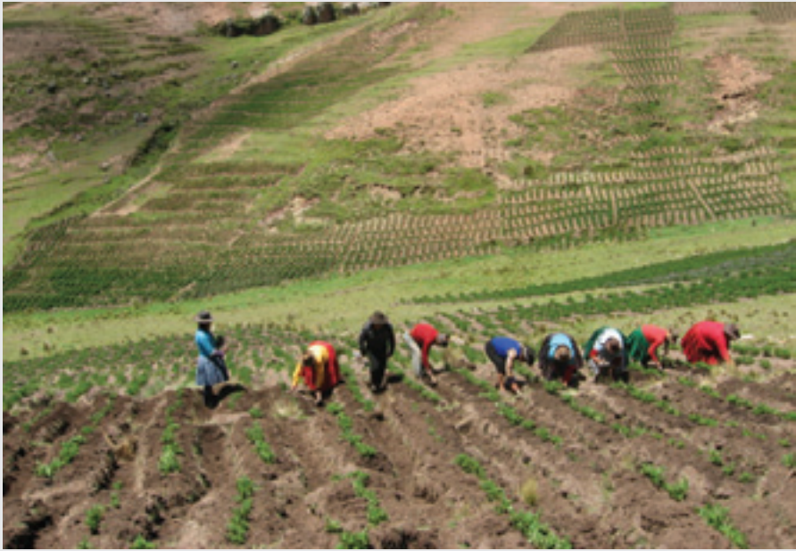
Foto: Preparación de terreno de cultivo en Cusco, Perú.