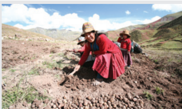
Fotos: Cosecha de papa en Cusco.

En este contexto de extremos sociales y económicos, el problema de la alimentación es parte de la agenda global, y los movimientos sociales empiezan a discutir esta problemática y desarrollar propuestas desde una perspectiva crítica hacia las políticas de los organismos internacionales que no han logrado solucionar el problema del desarrollo.