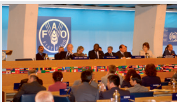
Foto: Reunión de la Cumbre Mundial de Alimentación. Roma 1996.

En la Declaración citada se cuestiona el concepto de “seguridad alimentaria” promovido por la FAO; además, la Declaración ha provocado el acercamiento de numerosas organizaciones de la sociedad civil y promovido un rico debate sobre el tema. De 1996 a la fecha, múltiples organizaciones alrededor del mundo se han adherido a la Declaración y han hecho suyo el concepto de soberanía alimentaria, contribuyendo así a su enriquecimiento.