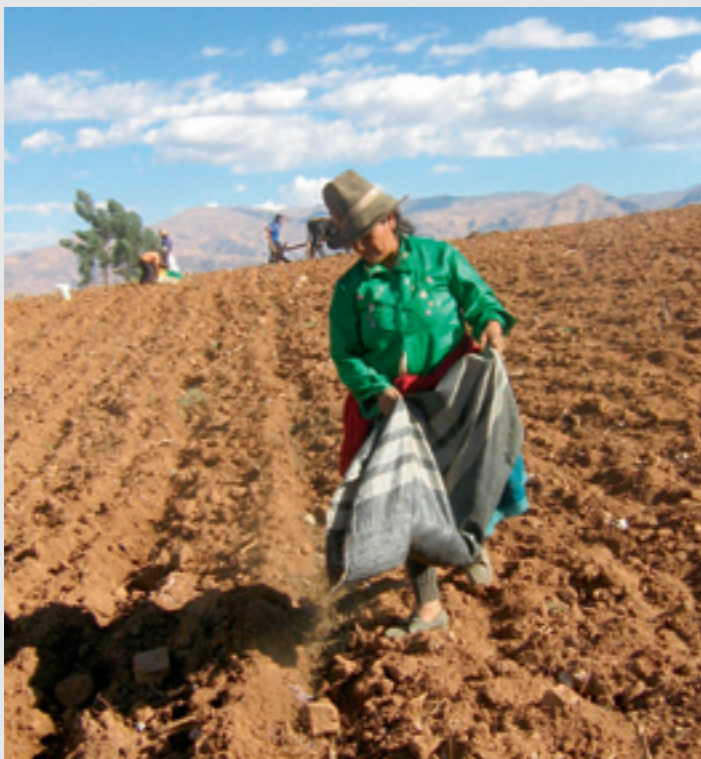
Foto: El 50% de las unidades agropecuarias del Perú, son de menos de 3 Ha., siendo el área mucho menor en la zona andina.

En relación al valor bruto de la producción agropecuaria (alimentos y bienes intermedios- insumos), el 71,5% proviene de la pequeña producción (menos de 5 Ha.).