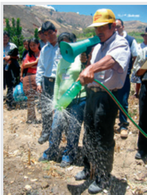
Foto: Productor rural de Ancash, Perú mostrando un sistema de riego artesanal.

Por otro lado, existe en el país un deficiente sistema de administración de riego y un bajo nivel de organización de las juntas de usuarios y comités de regantes debido a la falta de manejo de instrumentos y procedimientos técnicos y administrativos, y alta morosidad. Una de las razones de esta situación lo constituyen las reducidas tarifas por derechos de agua que pagan los usuarios, las cuales no cubren los costos de operación y mantenimiento de la infraestructura de riego, y no permiten la recuperación de las inversiones públicas en nuevas irrigaciones. Se requiere una legislación de derechos de agua más eficiente, que permita organizar un manejo integral y sostenible del agua.