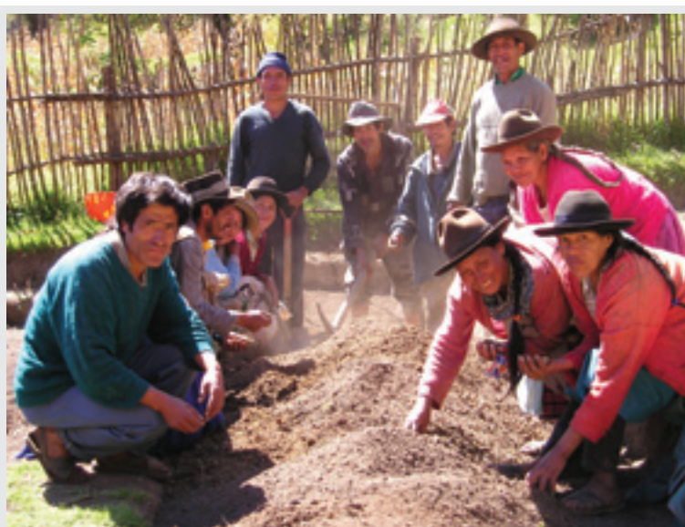
Foto: Las políticas alimentarias deben asegurar la calidad de vida de toda la población, especialmente de las más vulnerables.

Actualmente los programas del estado en materia de seguridad alimentaria y nutrición dependen del Ministerio de la Mujer y Desarrollo Social (MIMDES), Ministerio de Agricultura (MINAGRO), Ministerio de Salud (MINSA), Ministerio de Trabajo y Promoción del Empleo (MTPE) y del Ministerio de Transportes (MINTRA) y Comunicaciones (MTC).