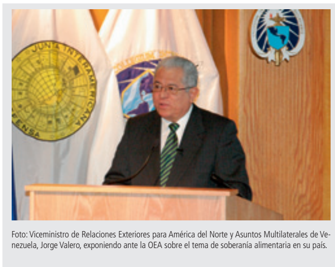
Foto: Viceministro de Relaciones Exteriores para América del Norte y Asuntos Multilaterales de Venezuela, Jorge Valero, exponiendo ante la OEA sobre el tema de soberanía alimentaria en su país.

Un hecho que el gobierno ha constatado en este esfuerzo por eliminar la desnutrición, es que lo que se produce de muchos bienes de primera necesidad no es suficiente para abastecer a la población, en parte porque una proporción importante de lo producido va a productos procesados de menor valor nutricional. Este es el caso de la leche, que no alcanza para todos porque una gran parte es destinada a productos superfluos o que no son de primera necesidad.