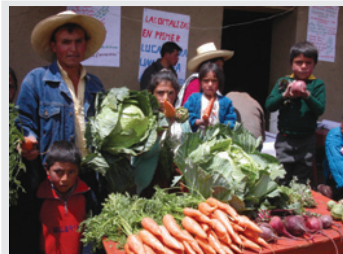
Foto: Toda persona tiene derecho a una alimentación adecuada

Veterinarios sin Fronteras, así como otros organismos no gubernamentales, consideran el derecho a la alimentación como el derecho a tener acceso, individual y colectivamente, de forma regular y permanente, a una alimentación adecuada y suficiente cuantitativa y cualitativamente, así como los medios necesarios para producirla, correspondiéndose con las tradiciones culturales de cada población y que garantice una vida física y psíquica digna.