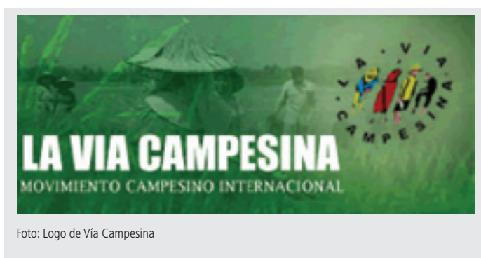
Foto: Logo de Vía Campesina