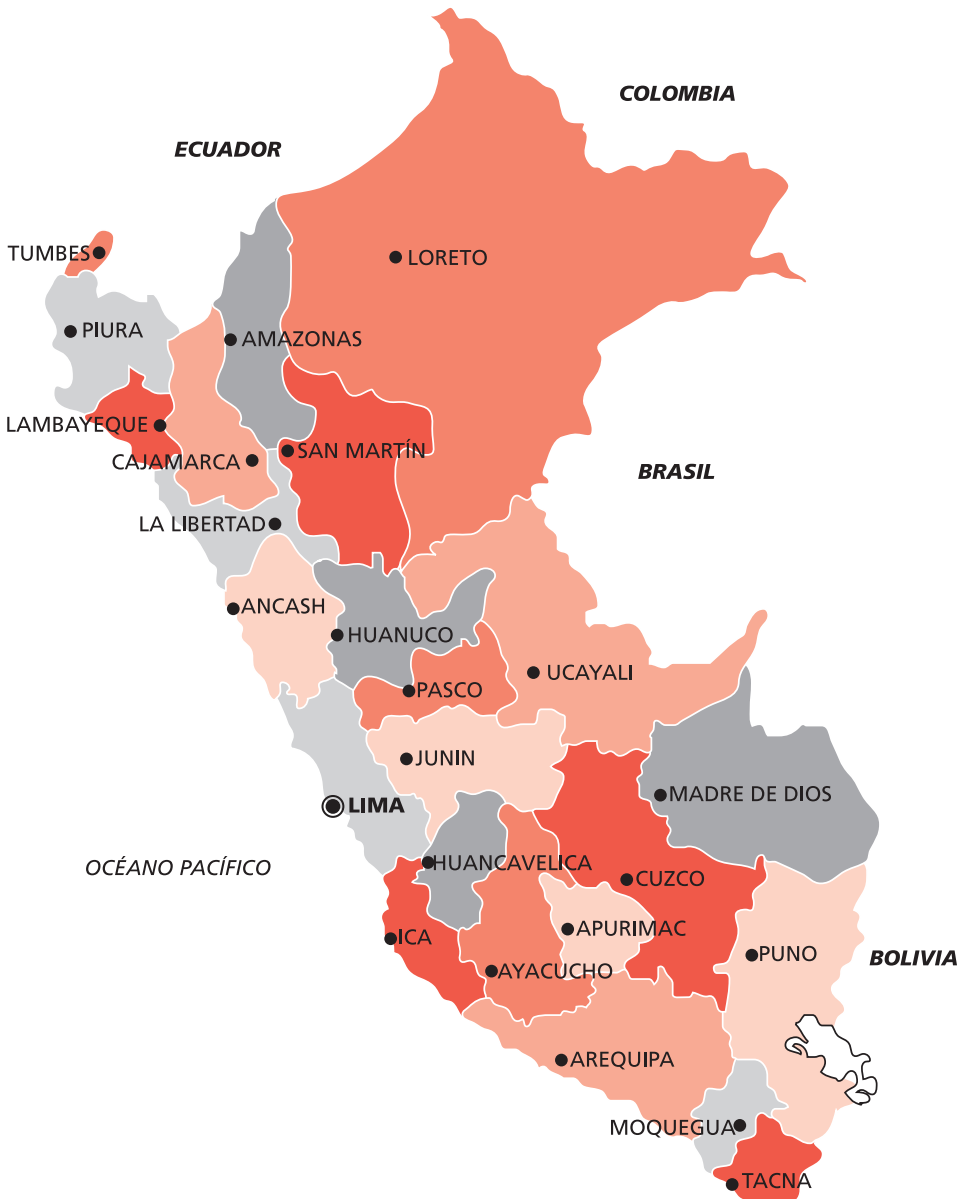
MAPA DE PERÚ